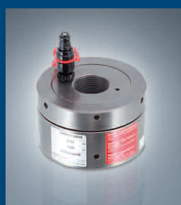
Spannwegunabhängige Hydraulikmutter mit Kontermutter Hydraulic nut, stroke independent with counter nut