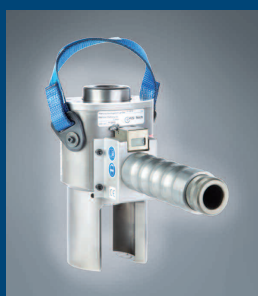
Sonderzylinder Special purpose cylinder