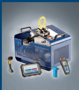
Messung, Überwachung und Dokumentation von Schraubverbindungen Measurement, Monitoring and Documentation