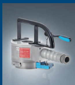
Automatische Schraubenspannvorrichtung Automatic bolt tensoning device