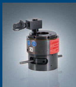
Einstufige Schraubenspannvorrichtung mit Gewinde im Kolben Single-stage bolt tensoning device with threaded piston