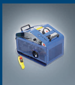
Elektrohydraulikaggregat / Spanngeräteaggregat Electric hydraulic power unit / Power unit for tensoning devices