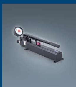
Handhebelumpen Hand-lever pump