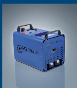
Elektrohydraulikaggregat akkubetrieben Electrical hydraulic power unit – battery driven / Power unit for tensoning devices