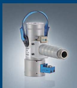
Mehrstufige Schraubenspannvorrichtung Multi-stage bolt tensoning device