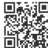
B-RAD BLU video