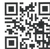
B-RAD SELECT video

Serię kluczy akumulatorowych B-RAD SELECT cechuje wysoki moment wyjściowy i swoboda użytkowania, wynikająca z zasilania z baterii.